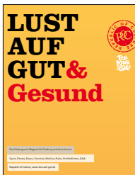
Titel / Ausgabe Special

Abholung in der Freiburg RoC-Botschaft ist kostenlos.)