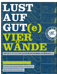
Titel / Ausgabe Freiburg 2021, Teil 1